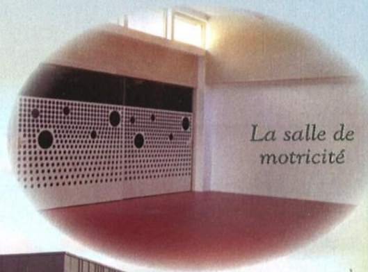
La salle de motricité