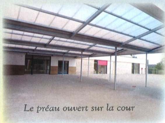
Le préau ouvert sur la cour