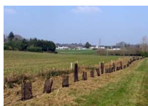
Haie à plat