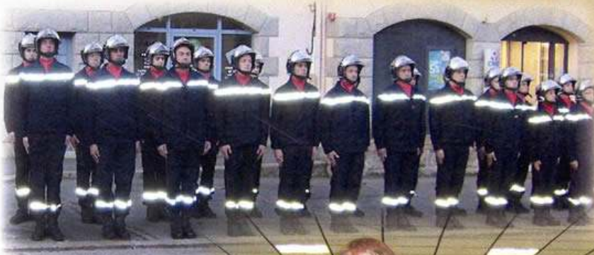
Le corps des Sapeurs Pompiers de Caulnes