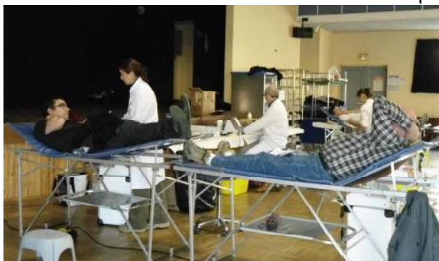
Photo : collecte du mardi 6 décembre 2011