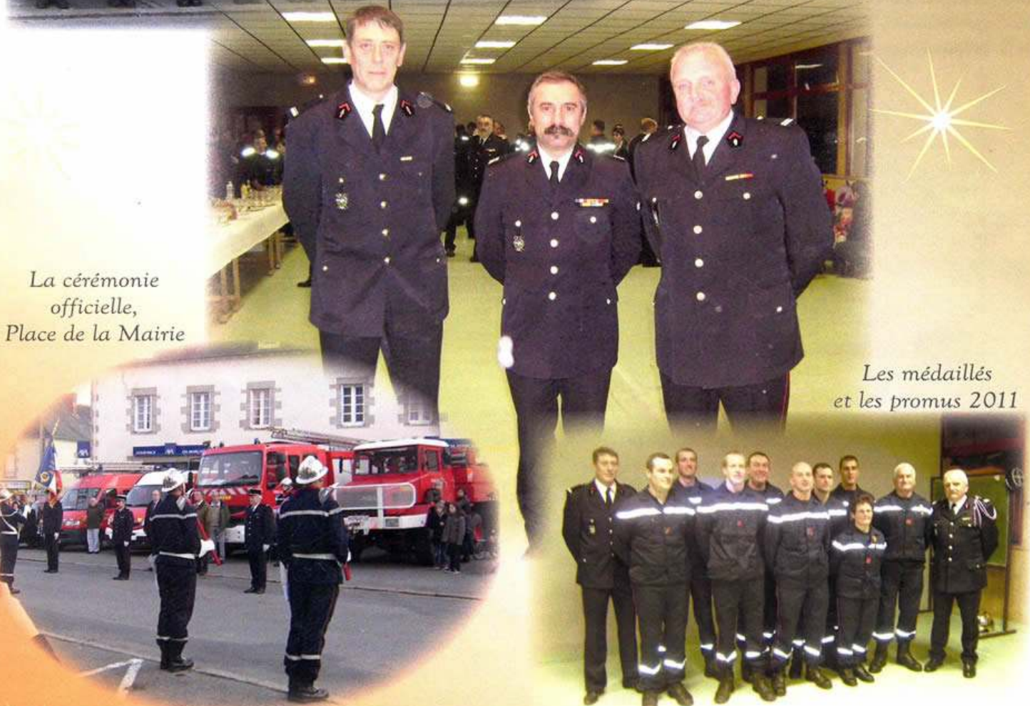
La cérémonie officielle, Place de la Mairie