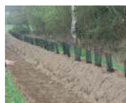
Haie sur talus