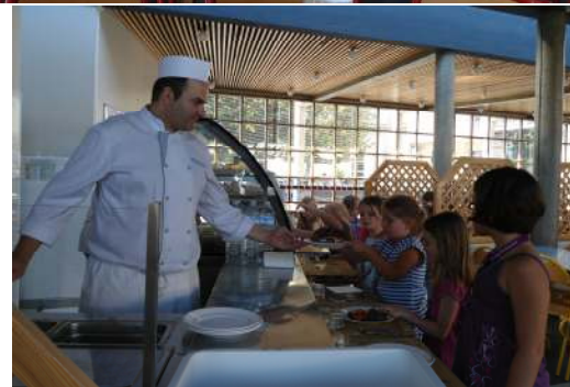
Passage au self pour les plus grands