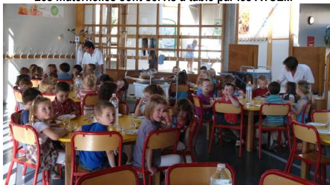
Les maternelles sont servis à table par les ATSEM

Au cours de l'année, des journées ou des semaines à thèmes seront réalisées en partenariat avec les élèves et le corps enseignant.