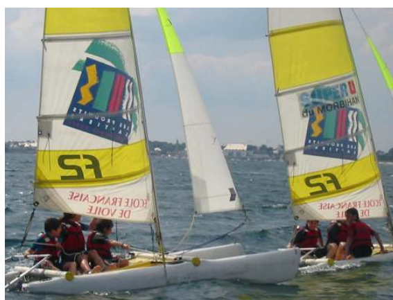
Les ados participant au camp de cet été à Larmor Plage ont pu pratiquer le catamaran.

L'autre rendez vous que fixe l'OIS aux sportifs du canton, c'est son tournoi inter-associations qui a lieu en mai, et qui a pour objectif d'inviter les clubs à former des équipes afin de passer un bon moment. Des rencontres d'ultimate (frisbee), de base-ball, de sarbacane, de golf, de foot avec ballon de rugby, de trampoline... s'organisent tout au long d'un après midi sportif et ludique.