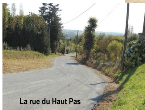
La rue du Haut Pas

L'entreprise EUROVIA, en charge des travaux, et le Cabinet TECAM (maître d'œuvre) ont fait leur possible pour ne pas perturber les riverains.