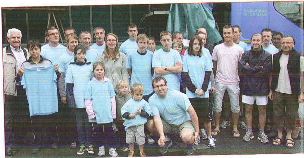
Félicitations aux organisateurs et à tous les participants