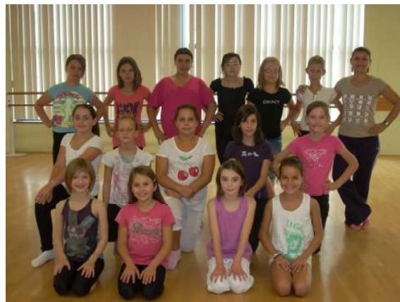
Le groupe des 10 et 11 ans

Vous pouvez encore rejoindre les différents groupes. Cécile vous accueillera avec plaisir.