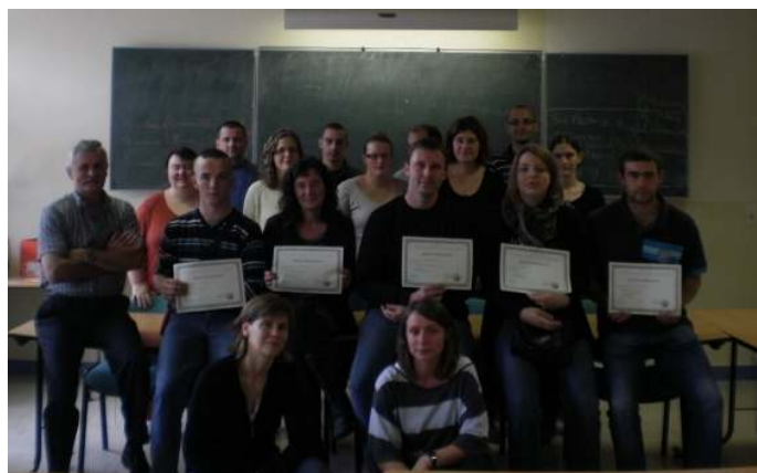
La remise des diplômes a été un moment de rencontre entre anciens et nouveaux stagiaires