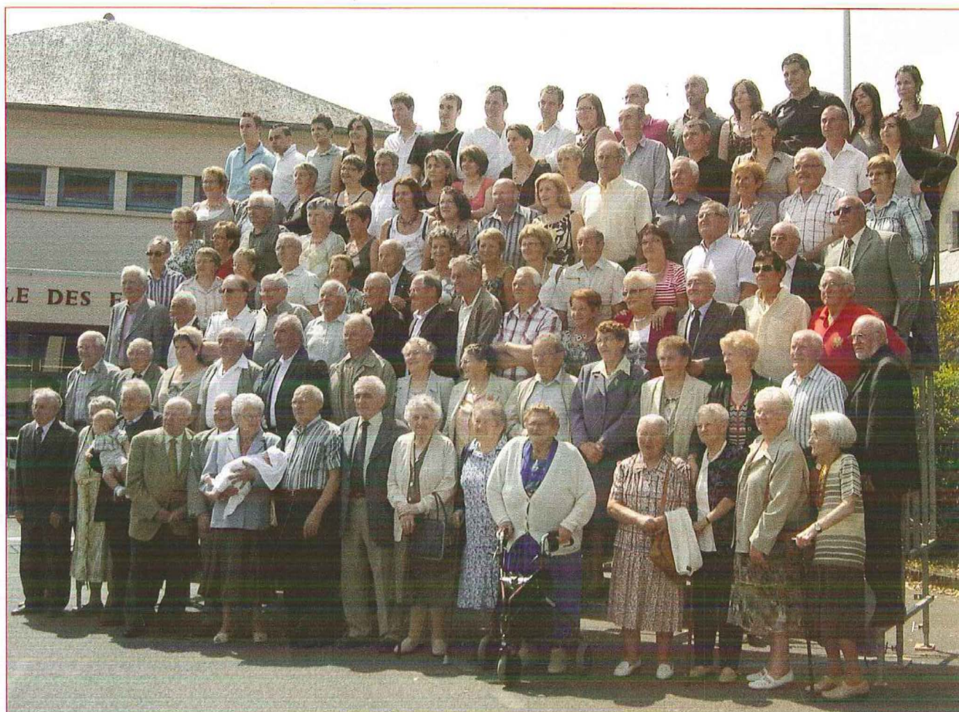
LE 30 JUILLET 2011 : LES CLASSES 1