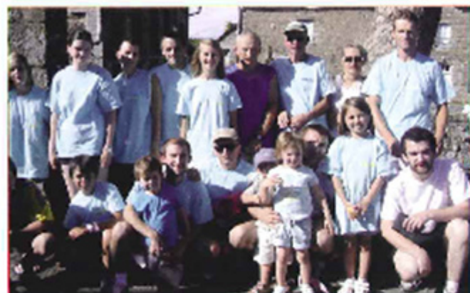
Samedi 10 Juillet : l'équipe de Couarnes qui a participé au Festival du Petit Football