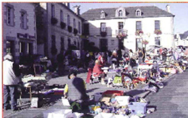
19 Septembre : 9 ème vide-grenier