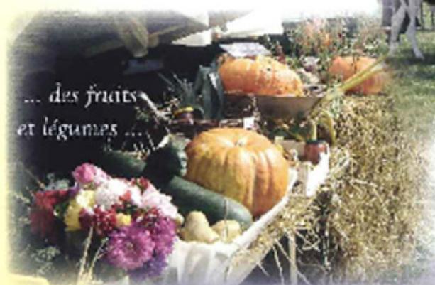
... des fruits et légumes ...