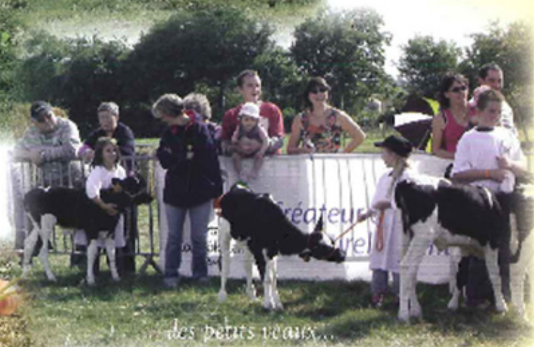
des petits veaux...