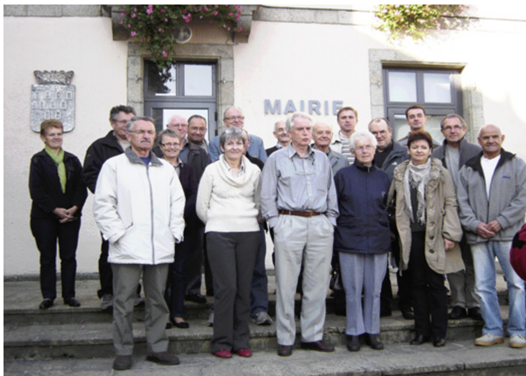
Groupe des élus et des riverains de la RD 766 qui a rencontré la Presse