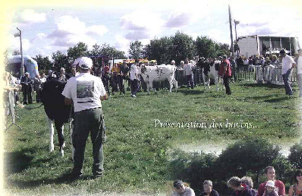
Présentation des bœufs...