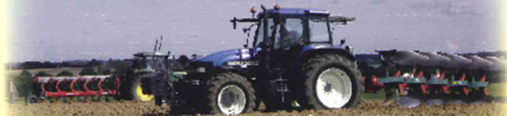
Concours de labours