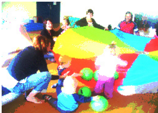
Atelier motricité, Caulnes, le 14 septembre 2010

■ Les espaces-jeux ont fait leur rentrée le 6 septembre. Pour ce début d'année scolaire nous retrouvons les animations telles que la lecture et l'éveil musical. Tous les jeunes enfants de moins de 3 ans accompagnés de leur parent ou assistante maternelle peuvent participer.