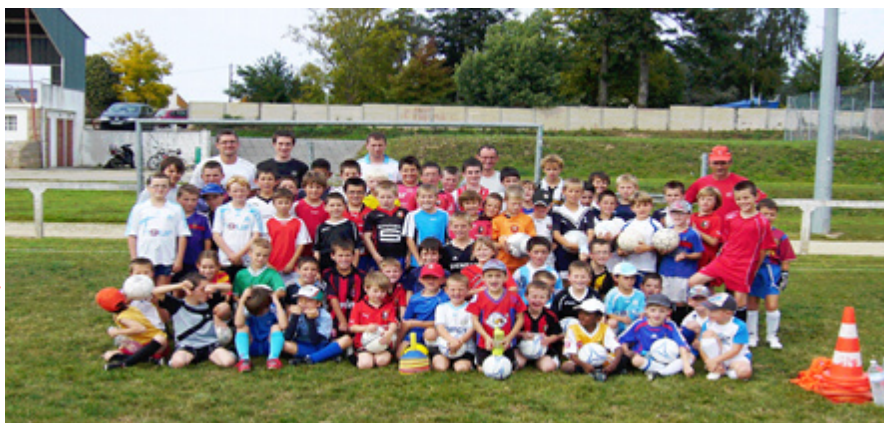
Photo : l'école de foot