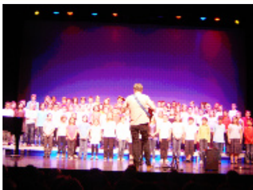
Participation des élèves de l'école élémentaire au chant choral Théâtre des Jacobins