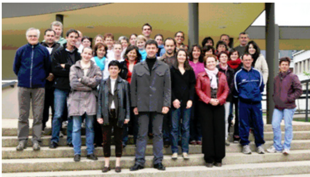
Une partie des personnels de l'établissement