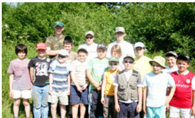
Concours annuel de l'atelier pêche et nature