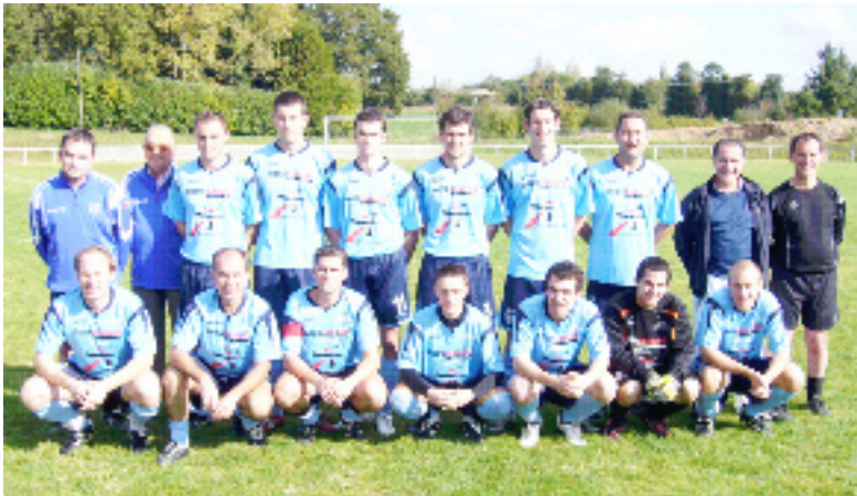
L'équipe B qui monte en D2

Félicitations aux dirigeants, aux bénévoles et à notre entraîneur.