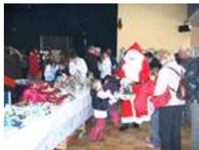
Le marché de Noël de l'association des parents d'élève de l'école maternelle et primaire s'est déroulé le dimanche 13 décembre.

N'oubliez pas la vente de Galettes et de crêpes à la sortie de l'école tous les vendredis à 16H30.