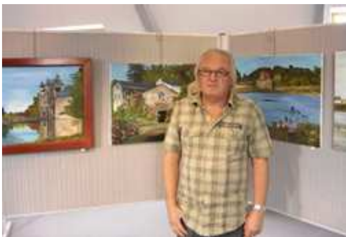
Exposition de peintures de Mr Jean SAILLARD Sur le thème « Campagne et bord de mer » Du 3 au 17 Octobre 2009

Journal d'informations trimestriel gratuit distribué à toutes les familles de la commune