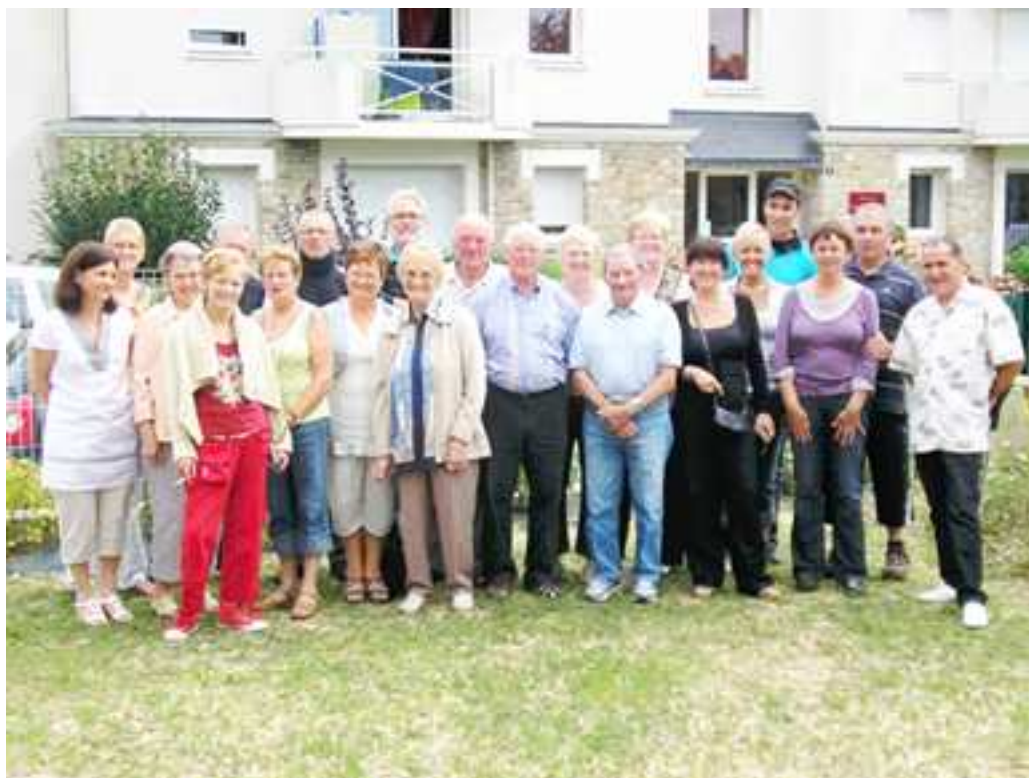
30 Août 2009 «Repas de quartier» des Rue Basse et Rue de la Hutte