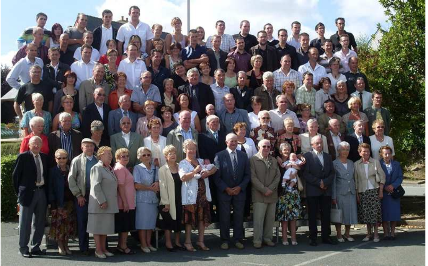
29 Août 2009 « Les Classes 9 »