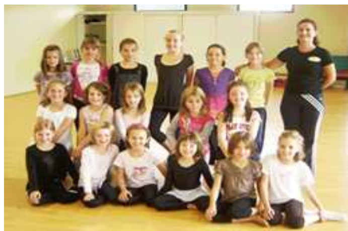
Le groupe des 8/9 ans