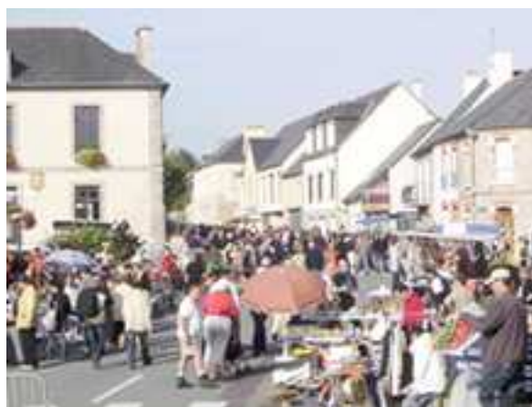
20 Septembre : 8ème vide grenier