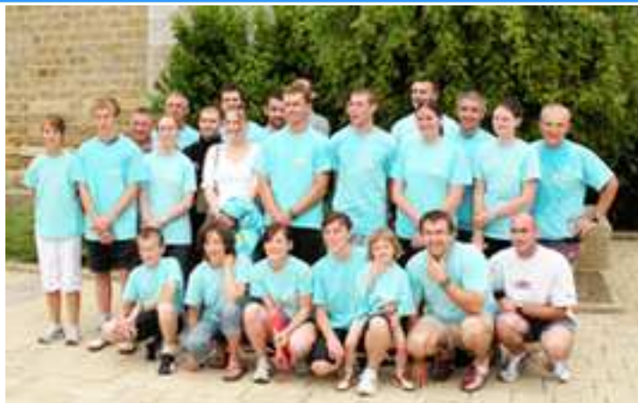
12 Juillet : L'équipe de CAULNES qui a participé victorieusement