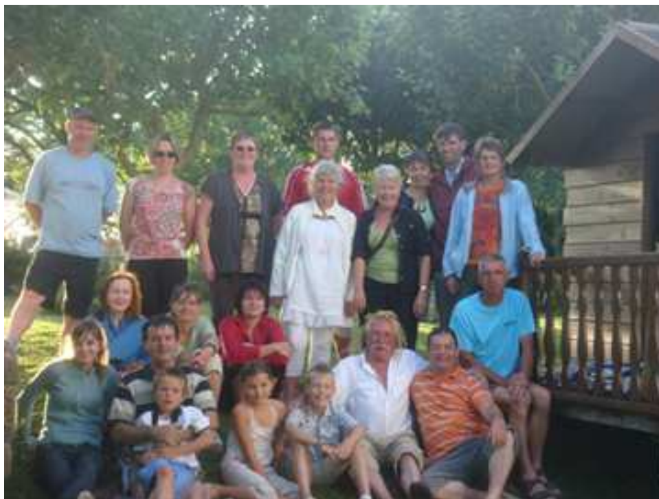
5 Juillet 2009 Les « Voisinades » de la Rue d'Yvignac la Tour