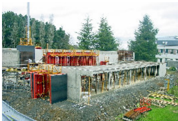
Le restaurant self service en construction

40 ans au service de la formation des jeunes du pays et du développement de l'agriculture. Les anciens élèves, apprentis et stagiaires intéressés peuvent prendre contact avec Mme Hédé au 02 96 83 92 68.