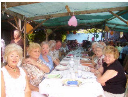
Repas grillades du 24 juillet 2008