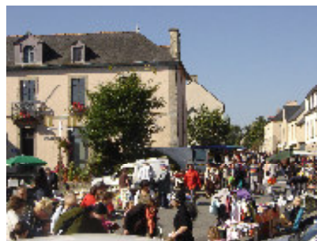
21 Septembre : Tème vide grenier