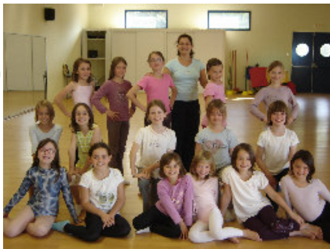
Le groupe des 8 - 9 ans