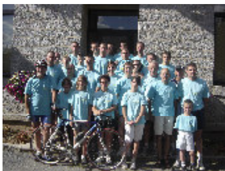
14 juillet : L'équipe de CAULNES qui a participé victorieusement au Relais du Petit Poucet