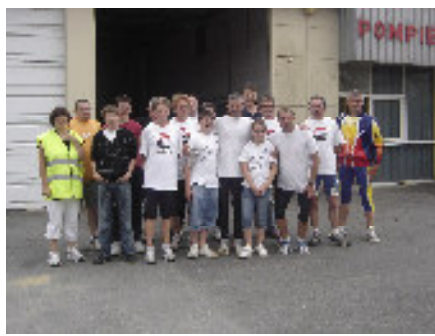
18 Juillet : Accueil du marcheur pour la solidarité à la caserne des Pompiers