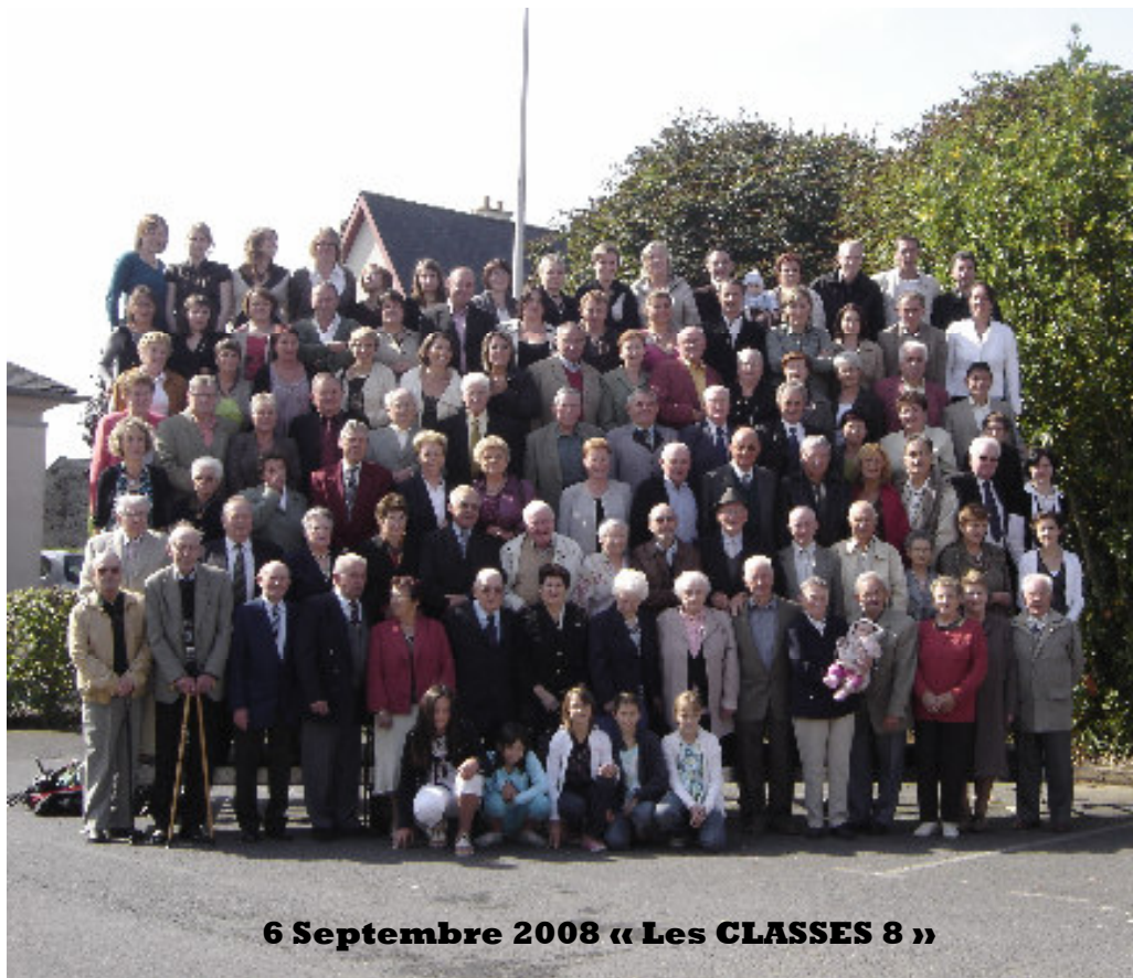
6 Septembre 2008 « Les CLASSES 8 »